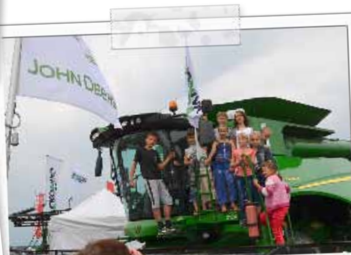
На такой технике согласны работать даже девчонки! Воронежские школьники на стенде «ЭкоНивы-Черноземье» на Дне поля — 2014